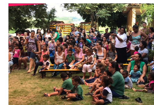
Aniversário 24 anos da Semente