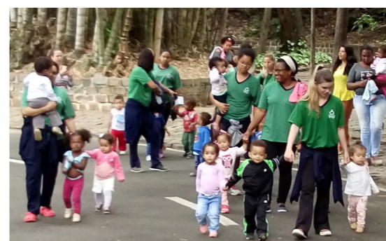
Passeio no Bosque