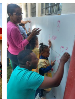
Festa da Família