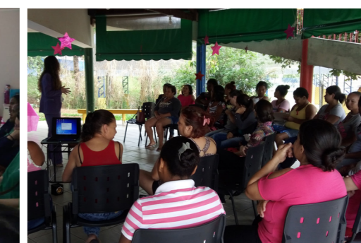
Palestra para Famílias