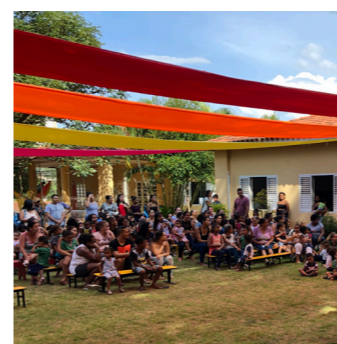
Aniversário 24 anos da Semente