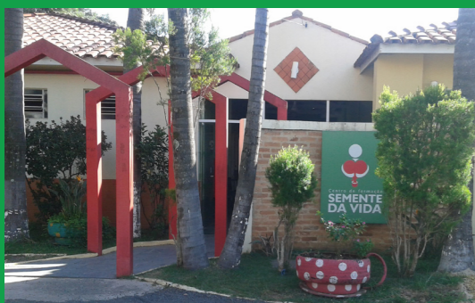
Entrada da Creche Semente da Vida