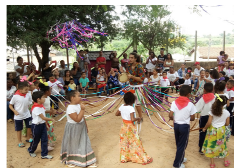
Festa da Cultura