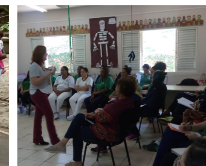
Capacitação de Professores