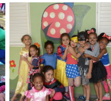
Semana da Criança